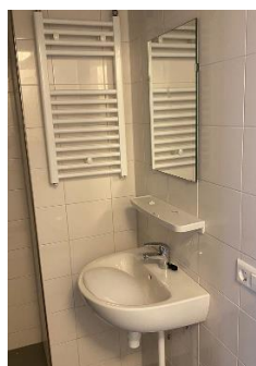
wastafel in badkamer