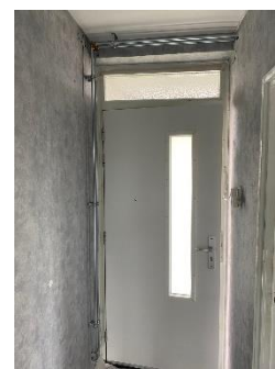
nieuwe voordeur en leidingwerk