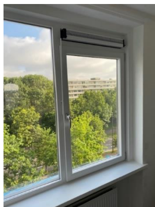
nieuw raamkozijn achterzijde