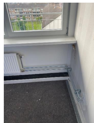
nieuwe radiator woonkamer